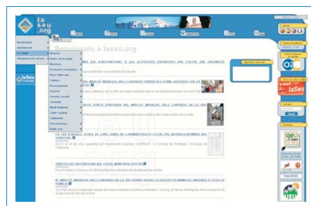
Web Municipal del ayuntamiento de la Seu d'Urgell