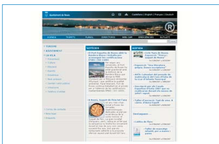
Web Municipal del Ayuntamiento de Roses