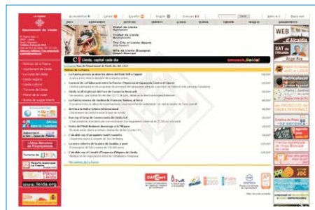
Web Municipal del ayuntamiento de Lleida