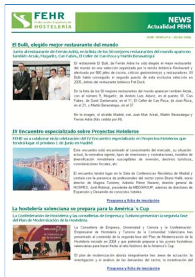
Exemple de Butlletí