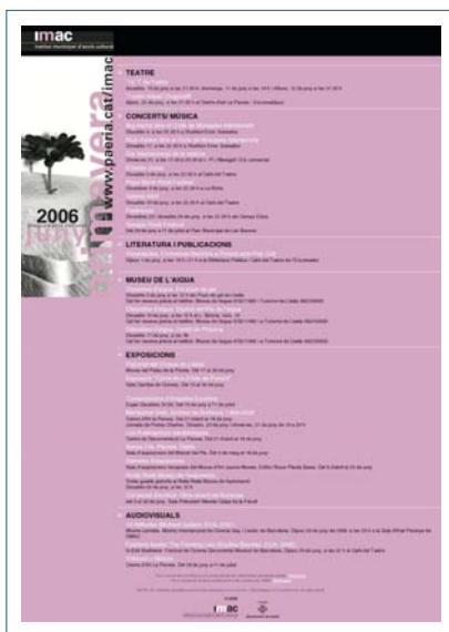
Exemple de Butlletí