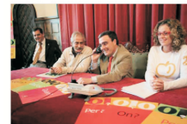
Lleida. Repartida en tres punts de l'edifici de l'Oficina Municipal d'Atenció al Ciutadà.